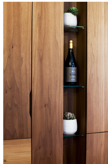
Cuisine en noyer français et îlot en Corian