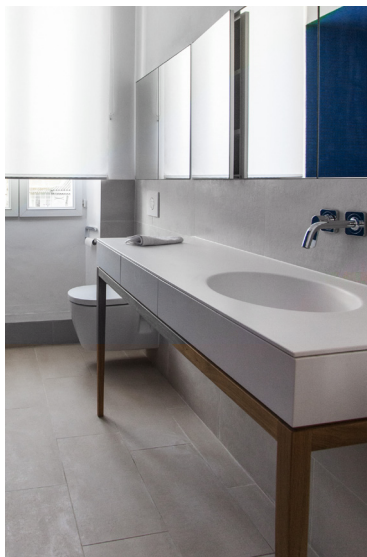
Vasque en Corian et rangements miroir encastrés