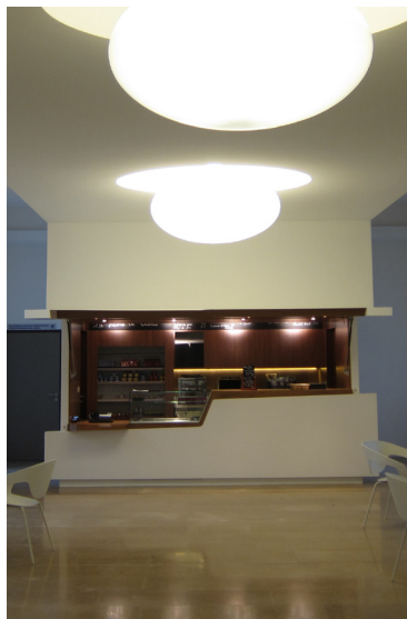
Buvette en Corian et merisier au CGD13