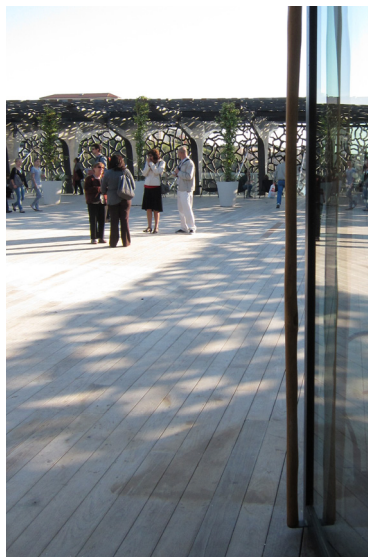
Bâton maréchal pour les portes du Mucem