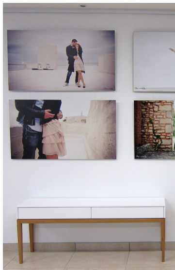
Mobilier d'exposition pour un magasin de photo