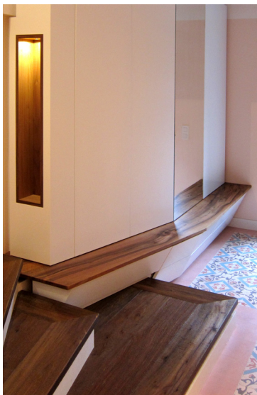
Meuble d'entrée en noyer et bois laqué